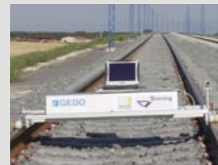
Leica TPS 1000, TPS 1100, TPS 1200 Trimble 5600, Trimble S6

Der Gleismesswagen ist in unterschiedlichsten Varianten, jeweils passend für Ihre Messaufgabe, verfügbar. Neben den verschiedenen Spurweiten wird auch den unterschiedlichen Einrichtsystemen beim Bau Fester Fahrbahn Rechnung getragen. So ist der Wagen beispielsweise auch in einer hohen Ausführung für das Einrichtsystem „Iron Horses“ erhältlich. Anstelle des Gleismesswagens kann auch eine mit Sensoren ausgestattete Gleismesslatte verwendet werden. Die Kommunikation zwischen dem Steuerrechner und dem Messwagen erfolgt über eine Bluetooth Datenverbindung.